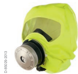
Dräger PARAT® 5500 Brandfluchthaube

Wechseln Sie nach 8 Jahren den Filter, erhöht sich die Lebensdauer auf insgesamt 16 Jahre. Dies bietet Ihnen auf lange Sicht eine große Kostenersparnis. Der Filter lässt sich nach entsprechendem Training sehr einfach eigenhändig wechseln.